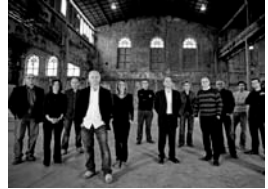
Grup Instrumental de València

Director del Grup Instrumental de Valencia Director de Moderna Música